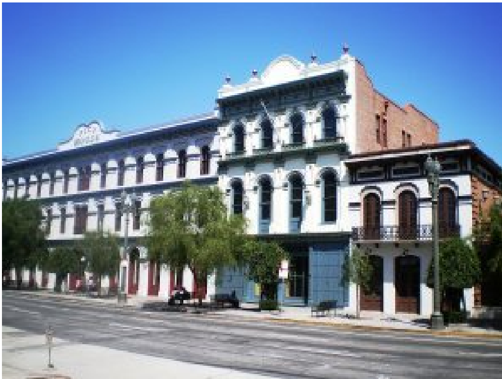
Figura 2.2: Ejemplo de arquitectura colonial española en la ciudad de Los Ángeles, California

Pero el español no sólo ha recibido el influjo de las lenguas germánicas y del árabe. A lo largo de la historia, y dependiendo de las circunstancias geopolíticas, la lengua española ha recibido léxico del italiano, francés y, más recientemente, el inglés. Esta última realidad lingüística es posible, en gran parte, debido a la presencia de grandes núcleos de población hispana en los Estados Unidos. Así, en Estados Unidos, además de los estados fronterizos con México (California, Arizona, Nuevo México y Texas), así como la Florida y la ciudad de Nueva York, que ya de por sí contaban con un buen número de hispanohablantes, existen otras entidades donde cada vez es más posible escuchar a la gente conversar en español. A tal grado, que es posible hablar de un español de los Estados Unidos tanto como se puede hablar de un español argentino, colombiano o salvadoreño. De hecho, según estadísticas recientes, los hispanos son la minoría más grande en los Estados Unidos, y Los Ángeles es la segunda ciudad con mayor número de hispanohablantes después de la capital de México.