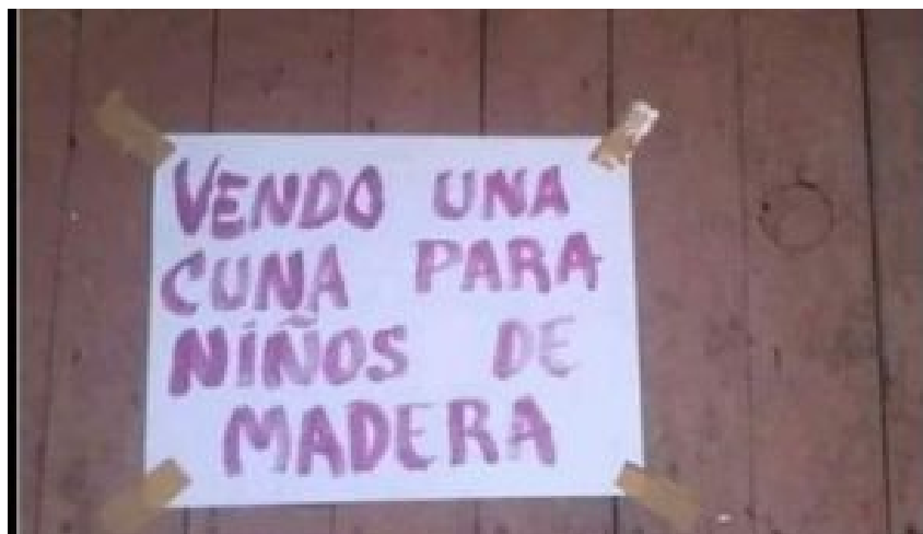
Figura 12.1 Ejemplo de anfibología