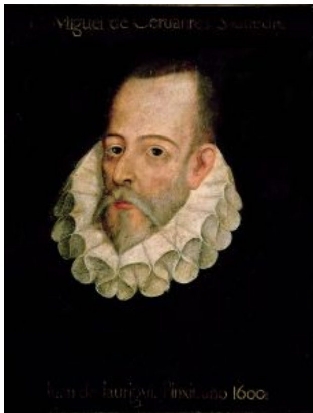
Figura 2.3: Miguel de Cervantes Saavedra, cuadro atribuido al pintor español Juan de Jáuregui (1583-1641)