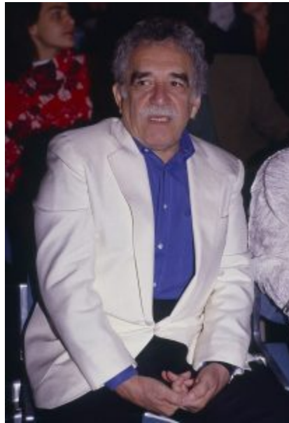
Figura 9.1: El escritor y premio Nobel colombiano Gabriel García Márquez

Como El Quijote , Cien años de soledad (1967) del escritor y premio Nobel colombiano Gabriel García Márquez (1927-2014) es una de las novelas más conocidas e influyentes de la lengua española. El libro aborda las tribulaciones de la familia Buendía en Macondo, pueblo imaginario que aparece recurrentemente en la obra narrativa del gran narrador colombiano.