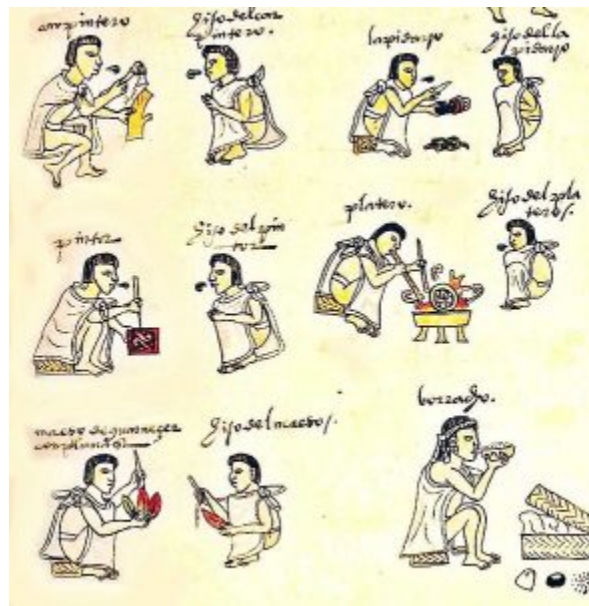
Figura 17.1 Detalle de la esquina inferior izquierda del folio 70r del Códice Mendoza, códice azteca de mediados del siglo XVI

INSTRUCCIONES: Ahora le toca a usted: Redacte un párrafo sobre un tema libre. Una vez terminado, relea y corrija las imprecisiones gramaticales o sintácticas de su texto. Luego, entregue su párrafo a un compañero de clase para que lo revise y le proporcione comentarios sobre la redacción en general. Por último, reescriba el párrafo con base en las sugerencias recibidas y entréguelo a su instructor.