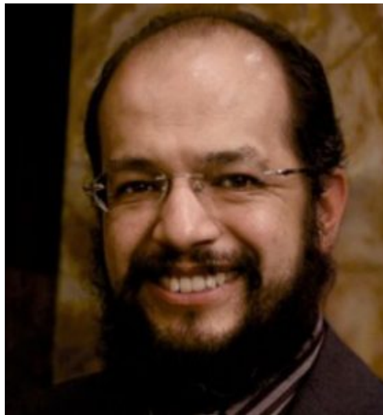
Figura 15.1: El filólogo, escritor y profesor mexicano Alejandro Higashi

INSTRUCCIONES: Lea el siguiente ensayo del filólogo y especialista en literatura medieval española y en poesía mexicana contemporánea Alejandro Higashi. Durante la lectura, no olvide buscar en línea o en la biblioteca los términos desconocidos.